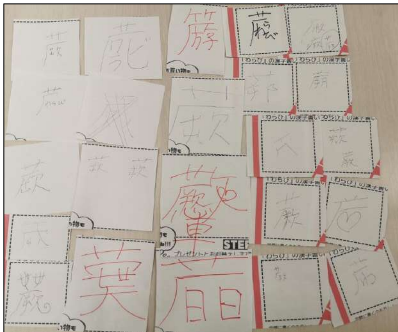
惜しい！気持ちは分かる！「完成していない蕨」たち

皆さんに「蕨」の漢字を書いてもらいましたが、草冠はだいたいの方がすぐ書ける。その下の「がんだれ」もまああ書ける。