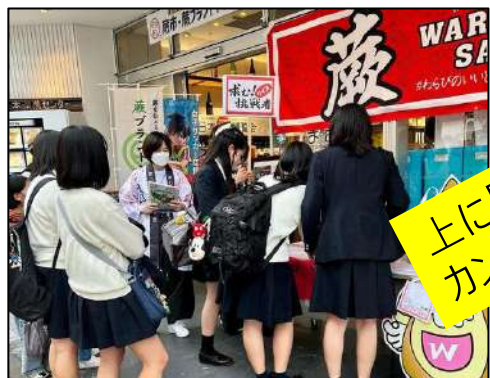
ノリがいい女子高生たち、知ってるけど誰一人かけませんでした・・・ありがとう！！